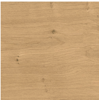
08837 OAK AMBIENT 1S