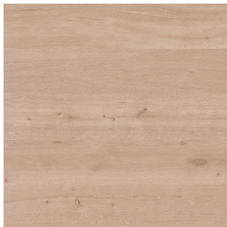
43617 OAK NEBRASKA 1S