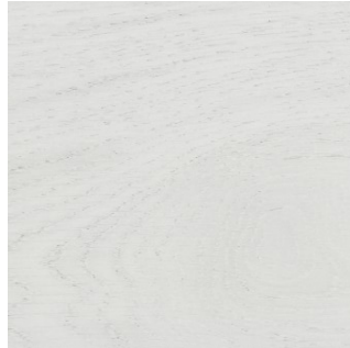
41184 OAK CHEESECAKE 1S