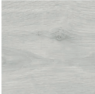
08461 OAK BALTIQUE 1S