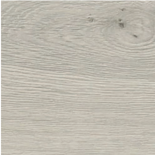
04278 OAK PANAMA 1S